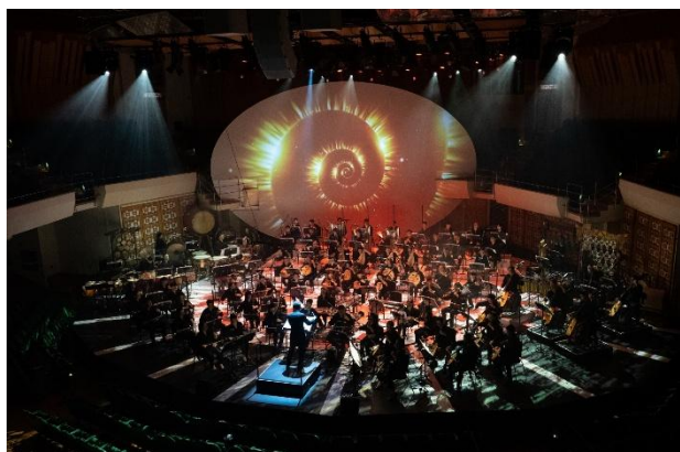
「日月·律呂·時之輪」- 把文化中心音樂廳變為如置身太空館的高端藝術旅程