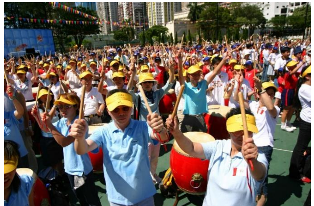
2003年舉辦首屆香港鼓樂節，樂團與三千多名香港市民在全港市民見證下於開幕式齊奏一曲《雷霆萬鈞》，鼓動香港市民在非典型肺炎疫症後的激勵鬥志，創下最多人同時演奏鼓樂的健力士世界紀錄。香港鼓樂節至今已連續舉辦22年。