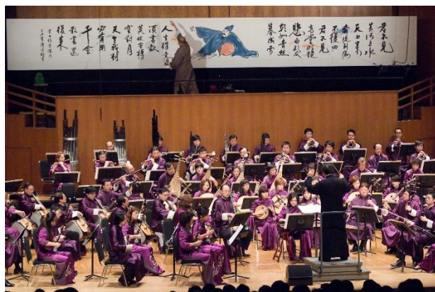
現場書法與中樂- 東方美學的體現