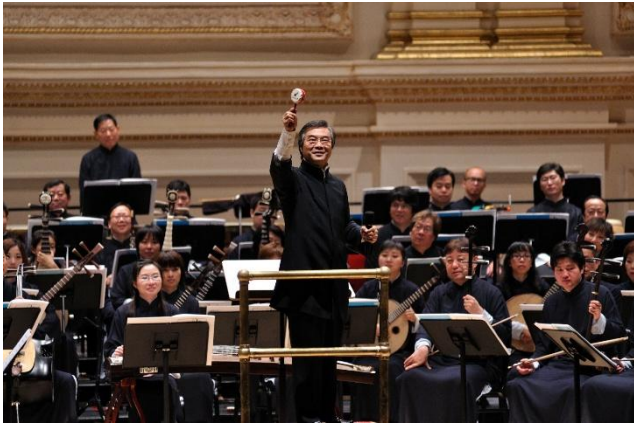
美國紐約卡內基音樂廳 (2009)