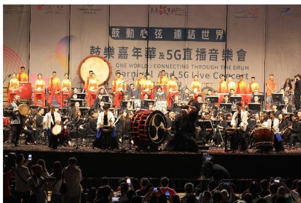
香港鼓樂節20周年「鼓動心弦 連結世界」，以鼓樂連結世界及全港十八區。鼓樂嘉年華及 5G 直播音樂會於西九文化區舉行，並以 5G 直播全球，被讚揚為「以文塑旅」的最佳典範之一。(2023)