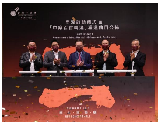
全球中樂界首個中樂網上音樂廳「HKCO Net Concert Hall」(2021)