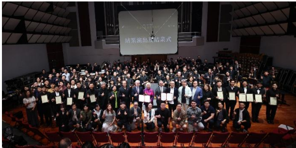
「國際中樂指揮大師班」自2009年首辦，共538位學員參與，選演了56首作品，舉辦了46個講座。