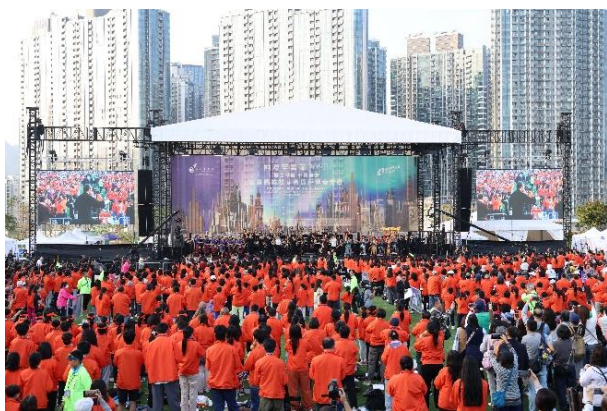
2026國際笙簧節-「笙生不息 - 千簧和鳴」笙簧馬拉松暨黃昏戶外音樂會，1,230名來自海內外的笙簧樂手世界首演《千簧和鳴》，並刷新健力士世界紀錄「最大規模的簧鳴樂器合奏」。