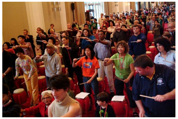
香港鼓樂節@美國華盛頓甘迺迪表演藝術中心 (2009)