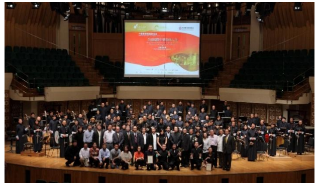
2011年首屆「國際中樂指揮大賽」，被譽為「中國音樂發展史上的里程碑」