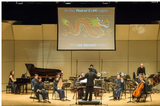
與盧森堡現代音樂協會合辦 「2013 國際作曲大賽」