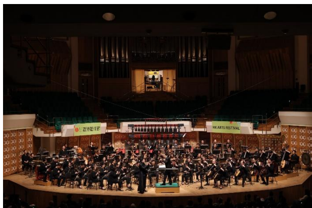
《簫》- 中西簫樂器笙與管風琴的對話