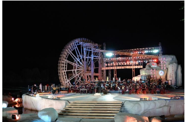
中國青海貴德縣黃河岸邊 (2008)