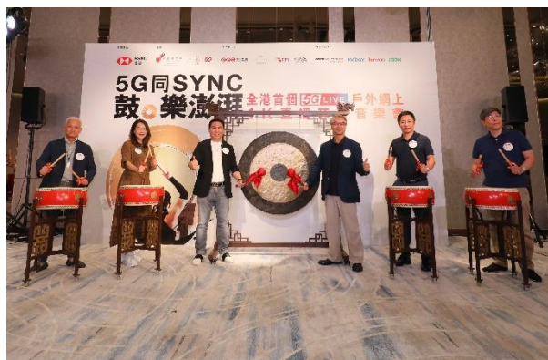
「5G同Sync 鼓·樂澎湃」全港首個5G Live戶外網上4K直播慈善音樂會(2020)