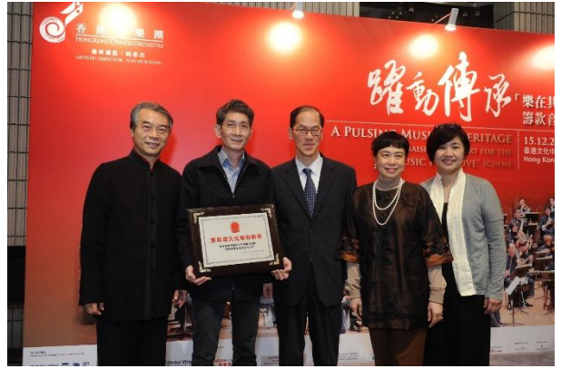
樂團「環保胡琴」系列2012年榮獲國家「第四屆文化部創新獎」，推薦單位為香港特別行政區政府民政事務局。