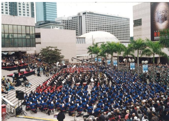
2001年舉辦首屆香港胡琴節，樂團及近千名香港市民共同締造的「千弦齊鳴」，首創最多人同時演奏二胡的健力士世界紀錄。