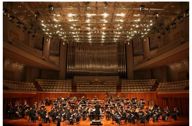
中國國家大劇院開幕國際演出季 (2008)