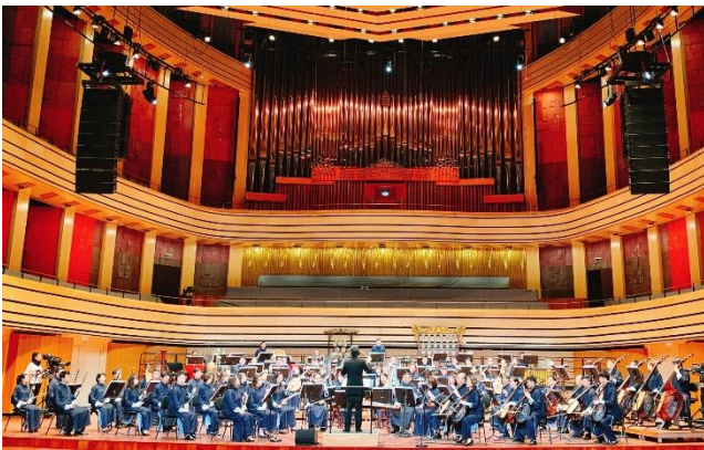
匈牙利布達佩斯藝術皇宮 (2020)