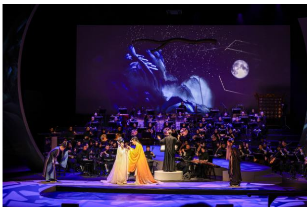
「月滿長生殿」- 崑曲與中樂的跨界交響